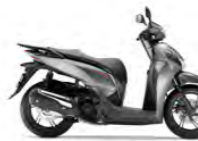
Air Force Grey